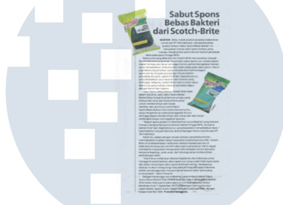
Gambar 3.4 Coverage Report untuk klien 3M