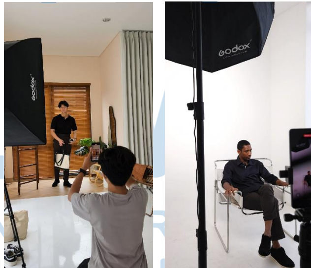
Gambar 3.7 Contoh sampel Video Behind the Scene (BTS) Photoshoot

Video Behind the scene merupakan video kompilasi dari video dibalik layar bagaimana photoshoot yang dilakukan pada produk-produk yang akan dijual, dalam hal ini penulis mengambil contoh video BTS yang diedit untuk produk Signore.id bulan Februari 2024 yaitu kaos Boxy , Jacket OT2 Semi Wool , Polo Knit , dan Trucker Jacket Suede .