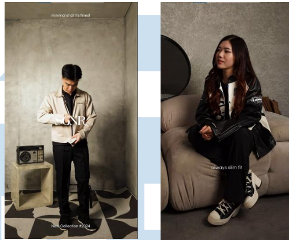
Gambar 3.6 Contoh sampel General Content Video