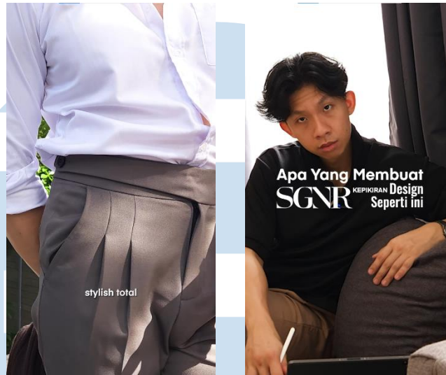
Gambar 3.3 Contoh sampel video Storytelling