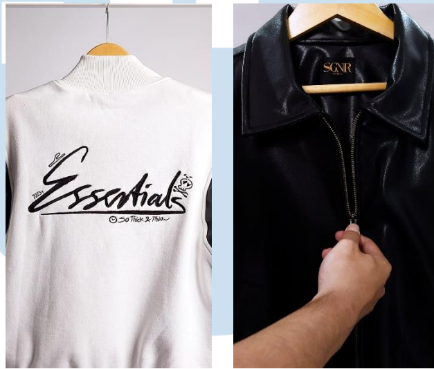
Gambar 3.5 Contoh sampel B-Roll Shot

B-Roll Shot merupakan video yang menunjukkan estetika dan detail produk namun tidak menggunakan model dan di shot di studio. Tujuan dari B-Roll Shot adalah untuk memamerkan fitur dan bahan produk yang ingin dijual. B-Roll Shot dapat memberikan daya tarik visual kepada audience . Penulis mengambil contoh B-Roll Shot pada produk Varsity Jacket dan Downton City Leather Jacket .