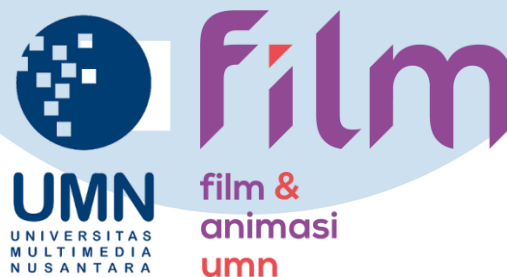
Gambar 2. 1. Logo UMN dan prodi film

Lab Virtuosity mulai berjalan di bawah naungan prodi film yang mulai berjalan pada tahun 2016. Universitas Multimedia memperluas Fakultas Seni dan Desain menjadi tiga program studi, termasuk prodi film yang saat itu bernama FTV. Program studi film menjadi wadah bagi mahasiswa yang hendak mendalami industri yang berfokus pada produksi film. Dengan niatan untuk memberikan mahasiswa pengalaman dalam dunia industri perfilman, dibentuklah badan organisasi Lab Virtuosity yang merupakan center of excellence bersifat non-profit di bawah naungan prodi film.