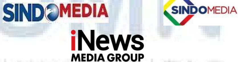
Gambar 2.1 Logo iNews Media Group

Hary Tanoesoedibjo selaku Executive Chairman MNC Group meluncurkan “iNews Media Group; The Largest Integrated News, Sport and newstainment di Indonesia dan Asia Tenggara. Pemberitaan Multiplatform : Televisi, portal berita online, radio dan media sosial” (inews.id). Kini, iNews Media Group yang mempunyai average audience share pemberitaan di 4 televisi free-to-air , yakni iNews, RCTI, MNC TV, dan GTV.