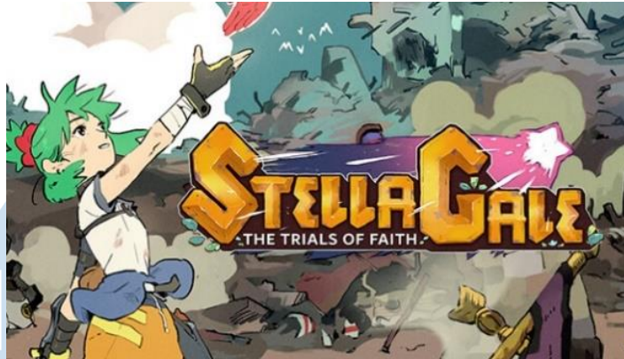
Gambar 2. 2 Key Visual Game StellaGale: The Trials of Faith