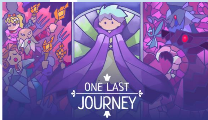
Gambar 2. 3 Key Visual Game One Last Journey

Meski game StellaGale: The Trials of Faith dan One Last Journey belum rilis secara publik, informasi mengenai pengembangan game tersebut telah diketahui dan menarik perhatian pemain lokal maupun internasional. Extra Life Entertainment terus menunjukkan eksistensinya melalui aktivitas game developer seperti acara Level Up KL, IGDx, Bogor Illustration Fair, Domino FX, Festival Indonesia Peta Anak Bangsa, Motion Ime Festival, Festival Ekonomi Keuangan Digital Indonesia (FEKDI) 2023, G2G Indonesia the Lazy Monda, dan Steam Fest. Untuk merealisasikan karya yang lebih berkualitas, Extra Life Entertainment juga berkolaborasi dengan studio indie Vifth Floor dan penerbit Outpost Game Inc. dalam pengembangan game StellaGale: The Trials of Faith .