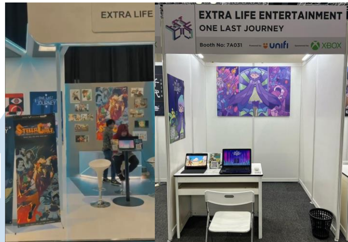
Gambar 2. 4 Booth Extra Life Entertainment di FEKDI 2023 dan Level Up KL

Antusiasme Extra Life Entertainment terhadap game berhasil ikut serta dalam pengembangan game lainnya seperti Blood and Dice , Poke the Cat , Noir the Untold , Great Marble Adventure , Lodaya Conquest , dan Wetani: Scarecrow in Shoot . Penghargaan yang dimenangkan Extra Life Entertainment pada Indonesia Game Festival membuktikan usaha tim dalam kualitas game yang dikembangkannya. Penghargaan yang dimenangkan antara lain; 1 st place best story , 2 nd place game of the fest , 2 nd place best art , dan 2 nd place best sound .