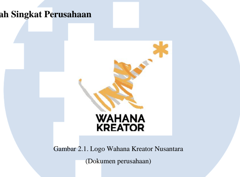
Gambar 2.1. Logo Wahana Kreator Nusantara (Dokumen perusahaan)

Didirikan pada tahun 2010, Wahana Kreator Nusantara (WKN) awalnya merupakan kumpulan penulis skenario yang bersatu untuk menciptakan sebuah komunitas. Pada awal tahun 2019, WKN akhirnya berdiri dengan tambahan studio editing dan rekaman. Berdasarkan data di website WKN terlihat bahwa WKN sebenarnya banyak terlibat dalam produksi film besar di Indonesia dalam hal penulisan naskah. WKN merupakan perusahaan produksi yang menghasilkan penulis dan pencipta berkualitas tinggi berdasarkan pengembangan dan penelitian. Selain menulis naskah, WKN juga melatih, membuat, dan mengembangkan konten original. WKN senantiasa berupaya melakukan evolusi dalam hal proses kerja dan standar penceritaan agar Wahana Kreator dapat terus memberikan kontribusi yang baik di Indonesia, khususnya di industri konten (Wahana Kreator, 2019).