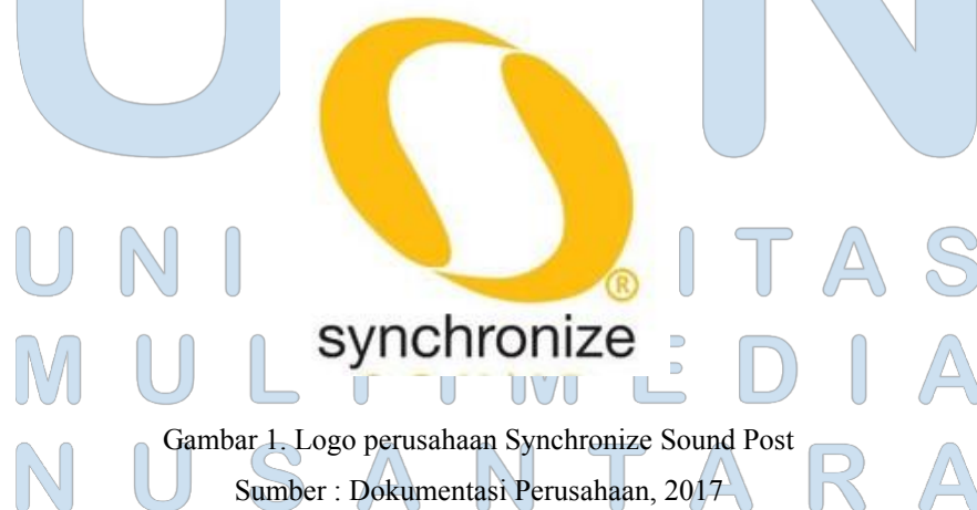
Gambar 1. Logo perusahaan Synchronize Sound Post

Latar belakang dibalik nama SYNCHRONIZE SOUND POST ialah menyesuaikan dengan prosedur pasca produksi suara di setiap proyek film di mana akan adanya sinkronisasi antara klip film yang telah diedit serta file suara yang sudah di mixing dan kemudian bisa dilakukan sinkronisasi antara dua klip tersebut agar terbuat sebuah film pendek maupun panjang. Kantor utama SYNCHRONIZE SOUND POST berawal beroperasi di Asem Baris, Tebet Jakarta selatan selama kurang lebih 7 tahun dan sekarang sudah pindah ke sebuah gedung perkantoran bernama Gedung TRK yang berlokasi di Manggarai, Tebet Jakarta selatan hingga saat ini