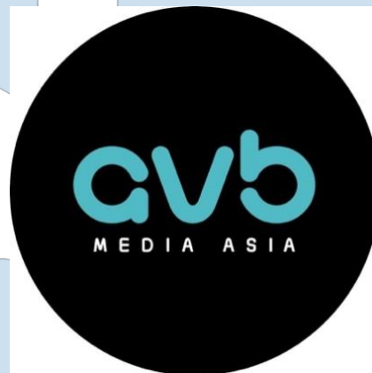
Gambar 2.1 Logo Perusahaan AVB Media Asia (Sumber : Data Perusahaan)

AVB Media Asia merupakan production house yang berbasis di Bali sejak 30 tahun yang lalu. AVB menyediakan layanan untuk produksi photo dan video secara profesional seperti pembuatan corporate company profile , marketing branding video , TV commercial , reels production dan lainnya, dan telah banyak bekerjasama dengan perusahaan-perusahaan terkenal di Indonesia maupun luar negeri, seperti contohnya Kementerian Kesehatan Republik Indonesia, Marriott International , Alam Sutera, dan berbagai hotel chain serta perusahaan terkemuka di Indonesia.