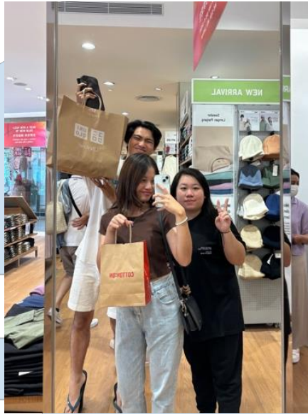
Gambar 3.2 Wardrobe & Property Hunting

Setelah melakukan pencarian wardrobe dan property , penulis bersama rekan production assistant lain menyiapkan konsumsi dan logistik yang diperlukan untuk hari produksi seperti menyediakan snack , kopi dan obat-obatan untuk crew . Dikarenakan penulis juga menjadi talent coordinator , maka penulis juga bertugas untuk memastikan jadwal shooting aman untuk talent dan memastikan talent untuk membawa segala keperluan untuk shooting .