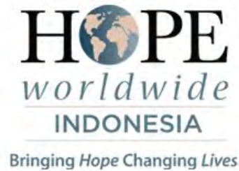
Gambar 2.2 Logo HOPE Worldwide Indonesia ( www.hopeindonesia.org )

Logo HOPE for Banten mewakili nama Center of HOPE yang sedang dibangun, yakni di wilayah Banten. Gambar provinsi Banten mewakili wilayah Banten dimana HOPE berupaya membawa harapan dan perubahan hidup yang lebih baik bagi masyarakat Banten.