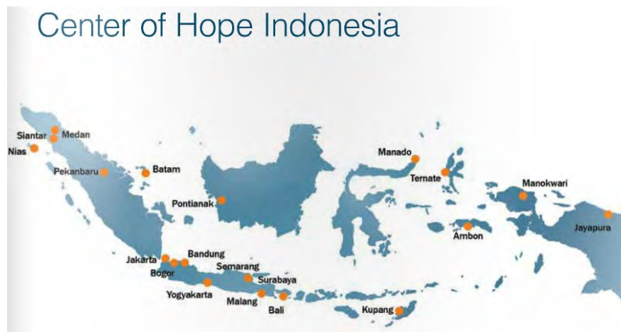
Gambar 2.1 Center of HOPE Indonesia ( www.hopeindonesia.org )

Tahun 1998, saat terjadi krisis moneter di Indonesia HOPE Worldwide Indonesia membangun sebuah program yang disebut dengan Computer Training Center . Pada tahun yang sama, HOPE Indonesia tercatat sebagai Organisasi Non-Pemerintah di Departemen Sosial bernama Yayasan Hope Indonesia. Klinik pertama HOPE di Muara Baru dipindahkan untuk melayani masyarakat di Plumpang, Jakarta Utara dalam memberantas penyakit TBC, penyakit mematikan ketiga di Indonesia. Sementara itu sejumlah Center of HOPE mulai dibangun di Pontianak, Surabaya, dan Medan. Memasuki tahun 2003, HOPE melakukan kemitraan dengan Citigroup Foundation memulai sebuah program yang disebut dengan Citi Success Fund (CSF) melalui “Citibank Peka” (Sebuah badan amal di Indonesia). Program ini memiliki tujuan yakni membantu para guru derajat SMA yang ada di wilayah Jakarta, Surabaya, Semarang dan Bandung dalam membuat aktivitas yang kreatif dan menyenangkan bersama para pelajar. Di tahun ini, HOPE Indonesia berjuang untuk memobilisasi sumber daya yang dimiliki melalui visi dan misi. Sehingga pada saat itu, berbagai macam kemitraan didirikan dengan berbagai organisasi seperti The Global Fund, HSBC, Eli Lilly Pharmaceutical, Bristol Myers Squibb, klub Lion, Hotel Borobudur, Universitas Chicago, Program Pangan Dunia, Organisasi Kesehatan Dunia, Bank Artha Graha serta sejumlah