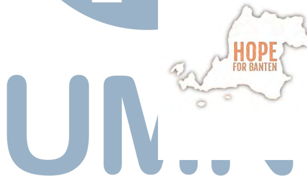
Gambar 2.3 Logo HOPE Banten (dokumen organisasi)

Logo HOPE for Banten mewakili nama Center of HOPE yang sedang dibangun, yakni di wilayah Banten. Gambar provinsi Banten mewakili wilayah Banten dimana HOPE berupaya membawa harapan dan perubahan hidup yang lebih baik bagi masyarakat Banten.