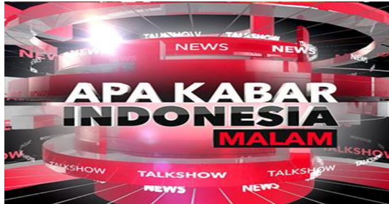
Gambar 2.2.2 Logo Program Apa Kabar Indonesia Malam