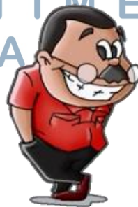
Gambar 2.1.5 Bang One