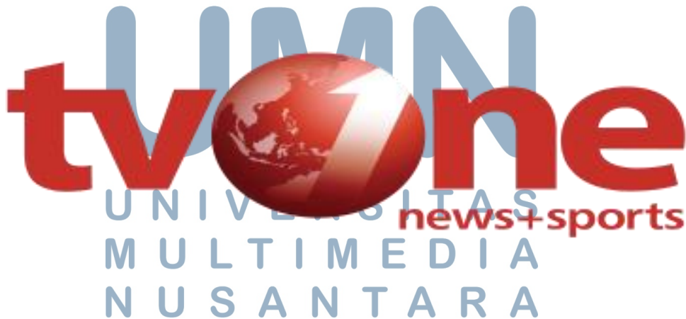
Gambar 2.1.2 Logo tvOne