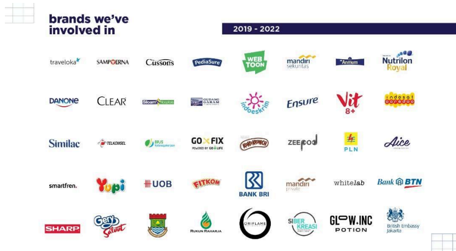
Gambar 2.3 Portofolio Let's Start Production