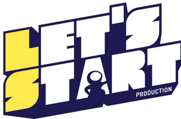
Gambar 2.1 Logo Let's Start Production (2021)

Pada website LinkedIn Let's start production ( Letsstartproduction | Desty Page ), Let's Start Production merupakan salah satu Production House yang bergerak di industri kreatif, kami dapat membantu bidang usaha/ perusahaan/ institusi anda memiliki media promosi dan informasi yang menarik dan kreatif sesuai dengan visi misi anda. Jasa kami meliputi pembuatan iklan (TVC, Digital, OOH, dll), company profile , video profil, VR/AR, Animasi 2D/3D, aplikasi dan lain-lain.”. Studio Let's Start Production ditemukan di tahun 2019 oleh Bayu Porsea Yudha, yang menawarkan jasa animasi 2D/3D, videografi, dan motion graphic . Bentuk bisnis studio ini adalah service based , dimana studio dipanggil oleh klien untuk menyelesaikan masalah kreatif klien.