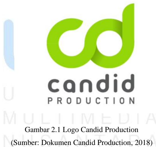
Gambar 2.1 Logo Candid Production