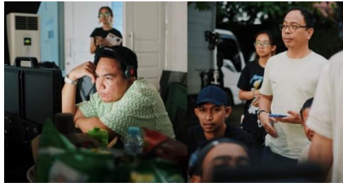
Gambar 3.3 Dokumentasi pada saat produksi Indomilk