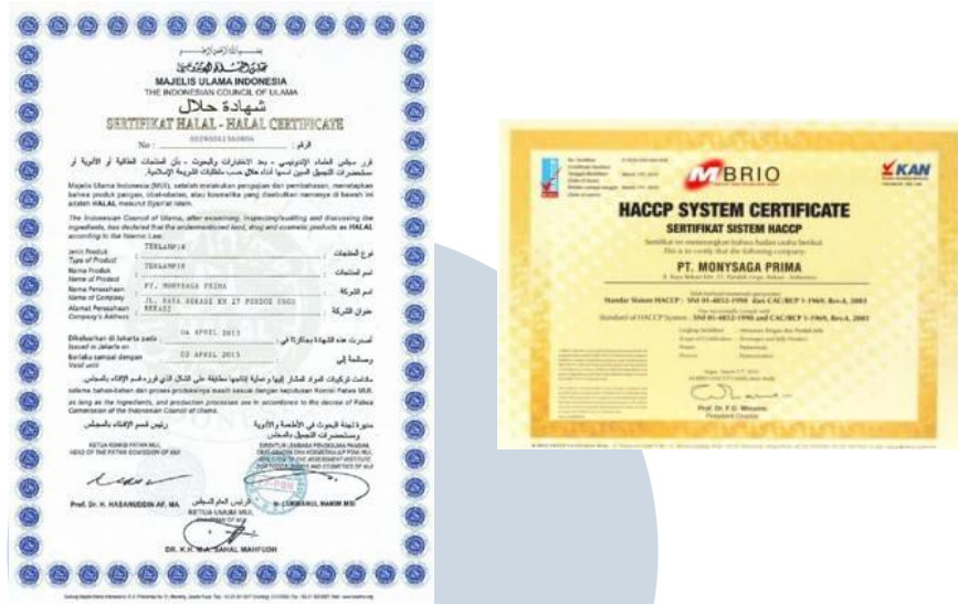
Gambar 2.9 Sertifikat Halal dan HACCP

Sebagai perusahaan yang bergerak pada produk minuman, tentu sertifikat Halal dan HACCP menjadi jaminan perusahaan kepada konsumen. Sertifikat Halal adalah bukti bahwa semua produk dari PT Monysaga Prima sesuai dengan aturan agama Islam. Sertifikat HACCP adalah bukti bahwa produksi yang dilakukan perusahaan sudah sesuai dengan aturan yang ada dan aman untuk dikonsumsi.