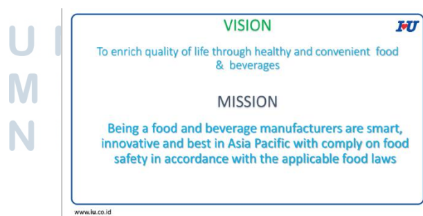
Gambar 2.1 Visi Misi

PT Monysaga Prima dan PT Inasetra Unisatya memiliki visi dan misi yang sama dengan induk perusahaan. Visi yang dijalankan adalah