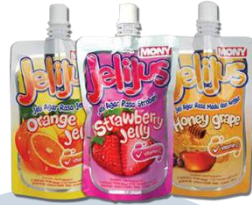
Gambar 2.6 Jelijus

Jelijus adalah jelly buah dalam kemasan standing pouch . Terdapat rasa jeruk, stroberi dan anggur madu. Ditujukan bagi anak-anak dengan jelly enak serta kemasan yang mudah di minum. Dengan target usia 4 sampai 12 Tahun serta masyarakat kelas ekonomi menengah kebawah.