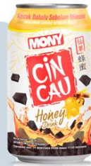
Gambar 2.7 Mony Cincau

Mony cincau adalah minuman cincau dengan ekstra madu dalam kemasan kaleng. Mony cincau saat ini menjadi produk unggulan dari PT Monysaga Prima. Hadir dengan tambahan sedotan menjadi nilai tambah produk ini diantara para kompetitorinya. Dengan harga relatif murah produk ini ditargetkan bagi masyarakat menengah kebawah dan usia 12 sampai 50 Tahun.