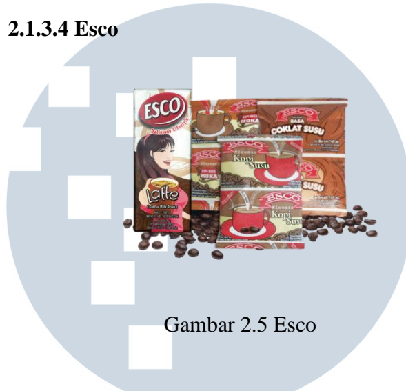
Gambar 2.5 Esco

Esco minuman kopi dalam bentuk bantal. Hadir dengan rasa latte, kopi moka, kopi susu dan coklat susu. Kopi susu adalah varian rasa yang paling laku di pasaran. Kemasan yang unik dan rasa yang enak merupakan daya tarik dari produk ini di pasaran. Ditunjukan bagi masyarakat menengah kebawah dengan target usia 15 sampai 40 Tahun. Produk ini sangat laku di daerah-daerah.