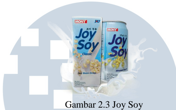
Gambar 2.3 Joy Soy

Joy Soy merupakan minuman sari kedelai. Terdapat dua kemasan yaitu kaleng (300ML) dan kotak (200ML). Hadir sebagai minuman kesehatan untuk tubuh dan kulit, namun produk yang satu ini kurang terkenal. Ditujukan bagi orang-orang menengah keatas dengan target usia 18-40 Tahun.