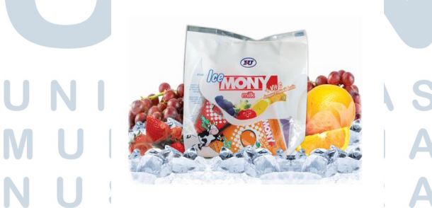
Gambar 2.4 Ice Mony

Ice Mony merupakan produk Monysaga yang sangat terkenal pada tahun 2000-an. Saat ini hadir dengan rasa jeruk susu, stroberi susu dan anggur susu. Dengan tiga rasa yang enak dan sehat tentu produk yang satu ini ditujukan bagi anak-anak. Ditujukan bagi