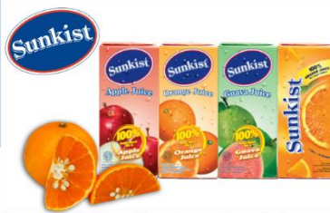
Gambar 2.2 Sunkist

Sunkist merupakan merek asal California, Amerika yang lisensi penjualan dan produksinya dimiliki oleh PT Monysaga Prima. Hadir dengan tiga ukuran yaitu 1L, 200ML dan 300ML (kaleng). Sunkist merupakan minuman sari buah-buahan yang diolah dari buah segar dengan proses UHT dengan jaminan ke higienisannya. Minuman buah ini ditunjukkan kepada orang-orang yang tidak memiliki waktu dalam memakan buah-buahan tetapi