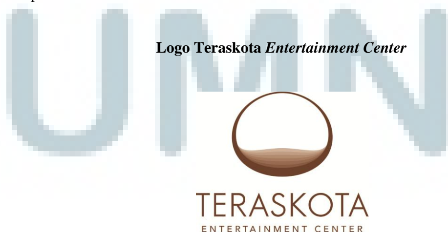
Gambar 2.1 Logo Teraskota

Filosofi Teraskota dapat dilihat dari logo. Logo perusahaan menjadi elemen yang penting dan merupakan simbol perusahaan yang bisa menampilkan citra perusahaan itu sendiri.