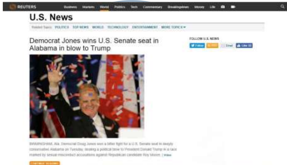
Gambar 2.2 Tampilan Situs reuters.com

Website : www.reuters.com/news/archive/indonesia