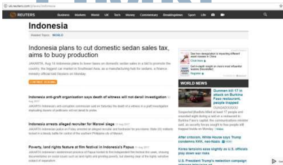
Gambar 2.3 Tampilan Situs Reuters Indonesia