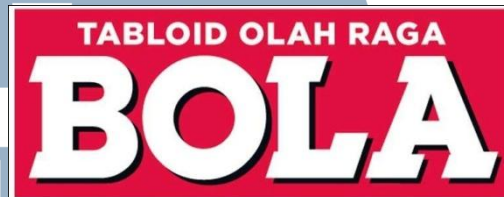
Gambar 2.1 Logo Tabloid BOLA