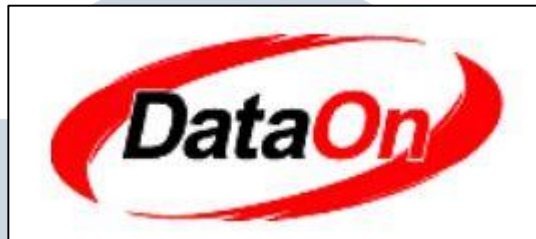
Gambar 2.1 Logo PT Indodev Niaga Internet, DataOn

bisnis yang nyata dengan solusi software yang nyata juga untuk cakupan organisasi dunia. Misi DataOn adalah membangun aplikasi software yang terbaik berdasarkan pada pemberian suatu solusi untuk customer , yang mana hal tersebut merupakan jalan terbaik untuk organisasi mereka.