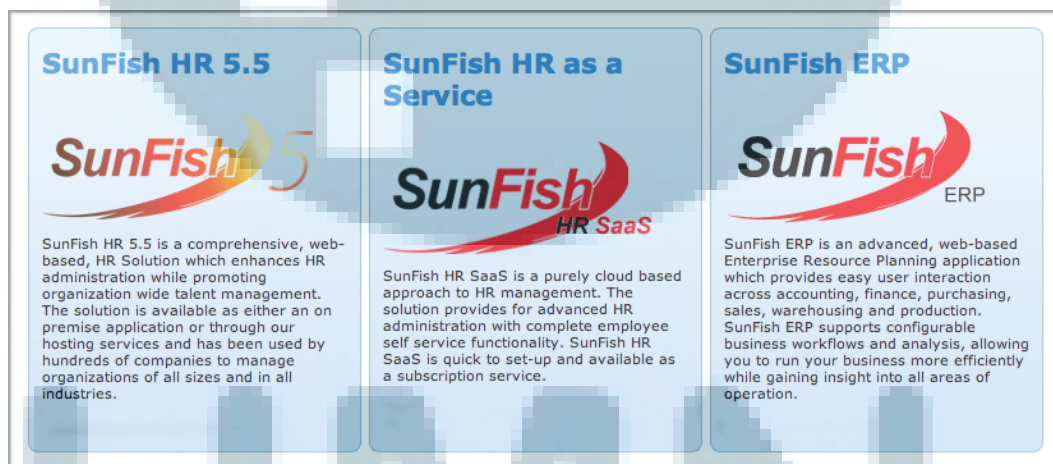
Gambar 2.4 Tiga lini produk yang di unggulkan di PT Indodev Niaga Internet

DataOn memberikan organisasi kemampuan IT dan infrastruktur yang dibutuhkan untuk menjalankan bisnis mereka lebih efektif, dengan hubungan antara pelanggan yang dilihat sebagai suatu hubungan jangka panjang dengan tujuan yang sama. DataOn memiliki 3 lini utama pengembangan produknya yang menjadi unggulan dari Perusahaan ini. Ketiga lini produknya itu adalah On Premise HR Zone, HR as a Service dan ERP Zone.