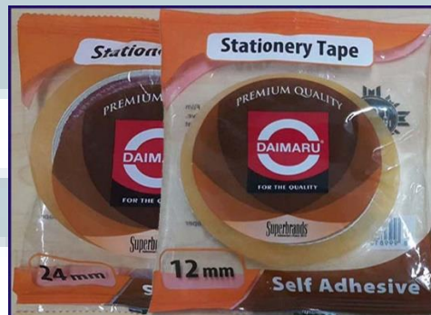
Gambar 2.9 Stationery Tape

Pita perekat yang digunakan untuk keperluan sehari-hari seperti untuk prakarya atau yang lainnya.