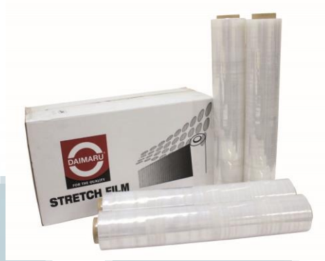
Gambar 2.10 Stretch Film