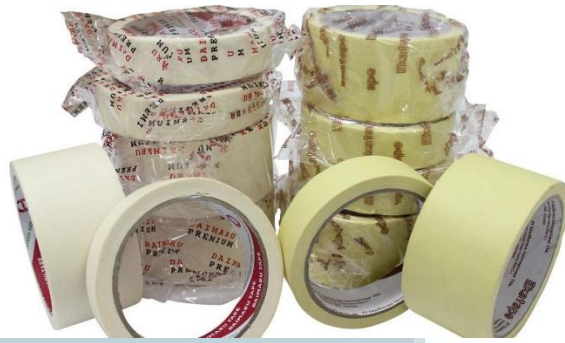
Gambar 2.6 Masking Tape