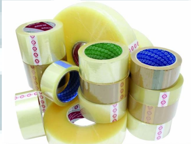
Gambar 2.7 Opp Tape

Pita perekat yang biasa kita jumpai sehari-hari. Pengaplikasiannya dapat digunakan untuk penyegelan karton dan lainnya.