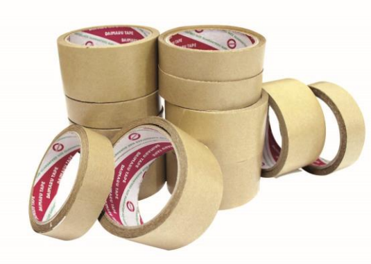
Gambar 2.5 Kraft Paper Tape

Pita perekat yang memiliki tekstur licin seperti keramik dan dapat diaplikasikan pada karton serta dapat bertahan pada kondisi ruangan yang lembab.