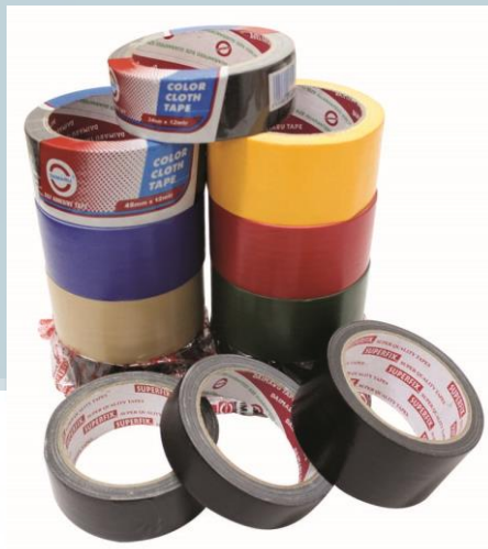
Gambar 2.3 Cloth Tape

Pita perekat yang digunakan untuk penyegelan karton, mengikat, memegang, melindungi permukaan dan dapat digunakan untuk lainnya.