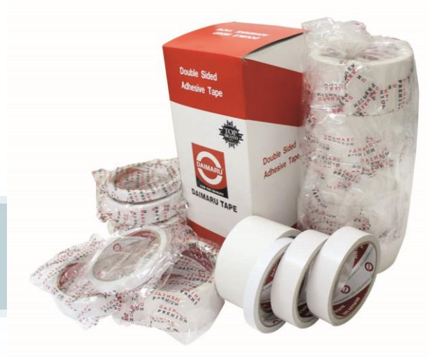
Gambar 2.4 Double Side Tape