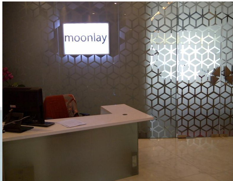
Gambar 2.1 Kantor PT. Moonlay Technologies