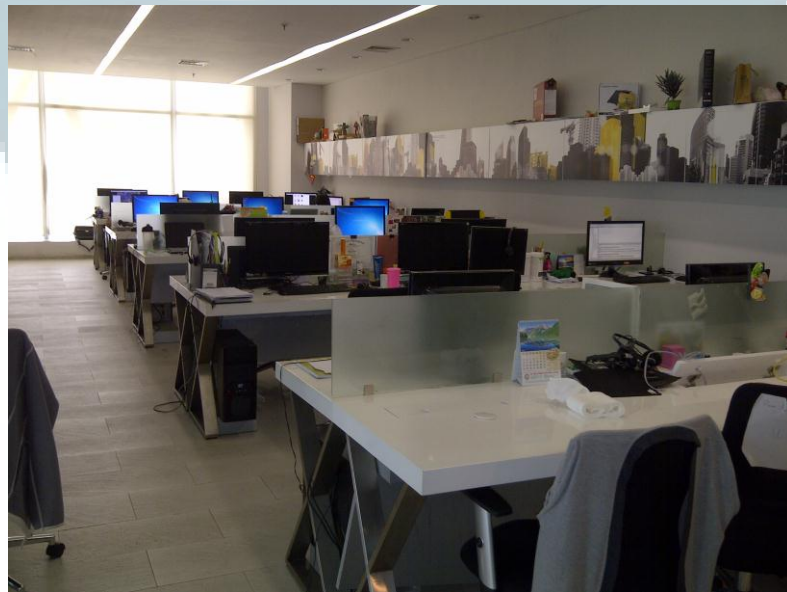
Gambar 2.2 Kantor PT. Moonlay Technologies