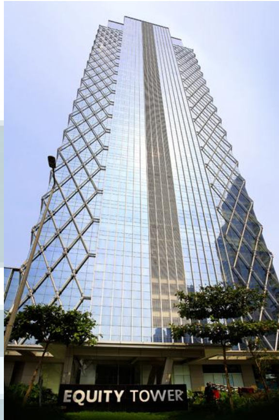
Gambar 2.3 Equity Tower