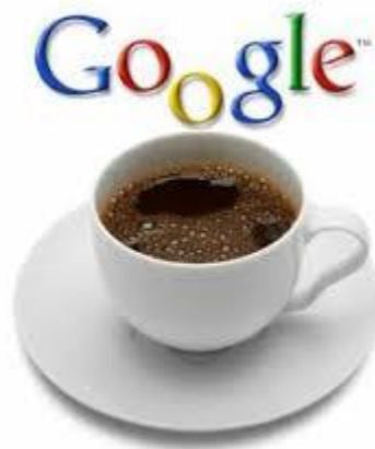
Gambar 2.3 google caffein

Diperkenalkan pada Agustus 2009, alogaritma ini pada dasarnya adalah bagaimana cara kita membuat website kita selalu fresh dengan update dan aktifitas baik itu dari pengunjung, komentar maupun pemilik situs. Bagaimana kita selalu memasang konten baru pada website kita, dan juga selalu bersosialisasi dengan website-website lainnya diperhatikan oleh google disini.