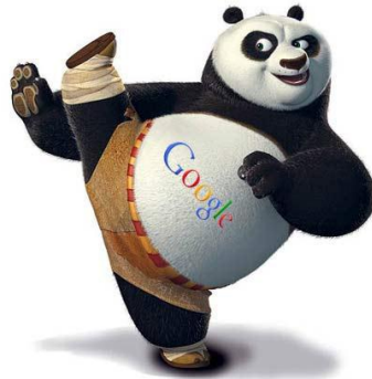
Gambar 2.5 Google Panda

Diperkenalkan pada Agustus 2012, Pada algoritma ini, situs-situs yang biasanya hanya memposting artikel dari hasil copy paste, mulai menjadi sasaran tendang google, ya tentu saja algoritma terus berevolusi, adanya update ini pun dikarenakan pada kala itu banyak sekali pelaporan-pelaporan mengenai copy right tentang suatu konten artikel pada suatu website yang kebanyakan isi konteyanya merupakan hasil comot-comot dari website lainnya. Banyaknya pelaporan itu membuat google menyertakan solusi ini pada updatenya. Tidak hanya website copy paste, website dengan konten yang buruk pun akan dengan segera akan google tangkap dan bersihkan. Namun kita tidak perlu takut pada hal ini, bila isi konten website kita adalah original dan juga di isi dengan konten yang baik, maka algoritma ini tidak akan berpengaruh terhadap page rank kita. So jadangan jadi webspam, buatlah konten yang menarik dan bernilai tinggi agar website kita selalu mendapatkan tempat yang manis yaitu page one google.