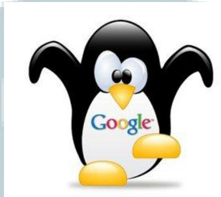
Gambar 2.6 Google Penguin

Diperkenalkan pada September 2012, inti dari algoritma ini adalah semangat google untuk memerangi spam, algoritma ini adalah bentuk penyempurnaan google dari algoritma sebelumnya yaitu panda dimana pada algoritma ini filter spam google telah dia asah menjadi lebih powerfull lagi, ya ini adalah beberapa hal yang di kategorikan google sebagai spam, diantaranya :