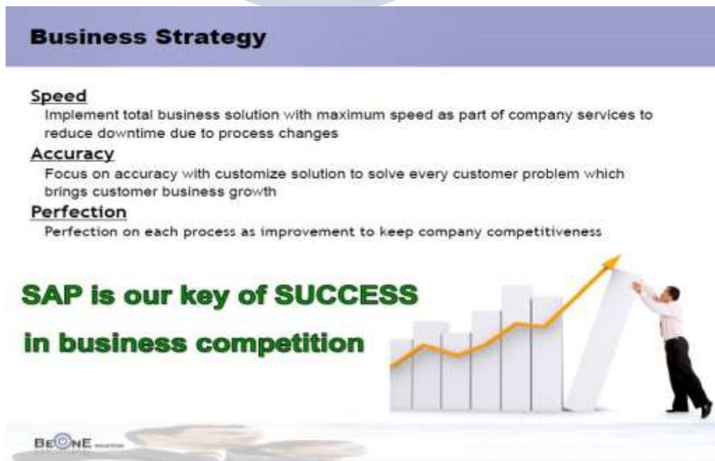
Gambar 2.2 Business Strategy Sumber : Dokumen Internal