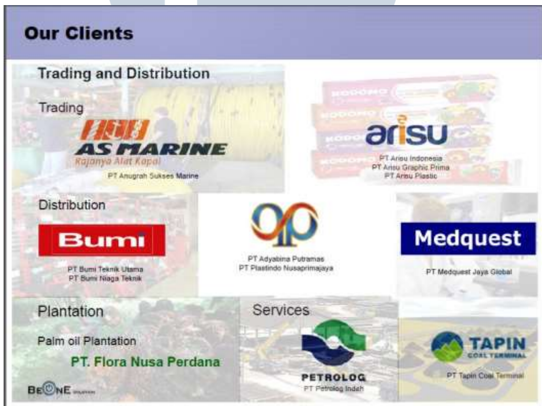
Gambar 2.7 Trading and Distribution Client