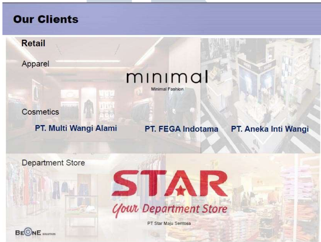
Gambar 2.8 Retail Client