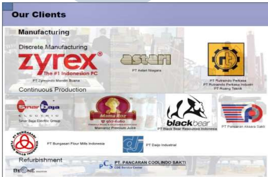
Gambar 2.6 Klien Manufaktur