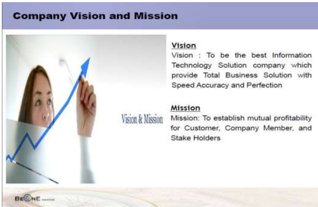
Gambar 2.1 Visi & Misi Perusahaan