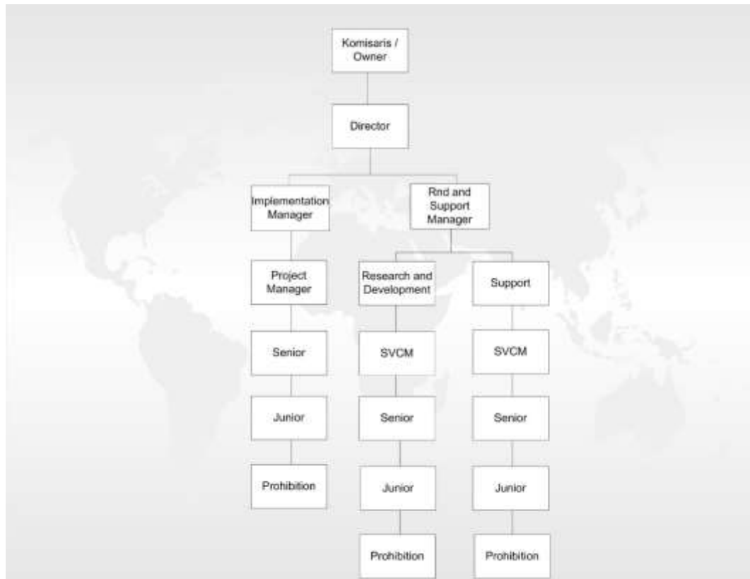
Gambar 2.4 Struktur Organisasi

Berdasarkan struktur organisasi diatas, penulis berada di bagian Implementation yang berada di posisi Junior Functional Consultant . Penulis selama proses kerja magang ini langsung berhubungan dengan bagian Senior Functional Consultant maupun dengan project manager saat ikut ambil bagian di dalam suatu project.