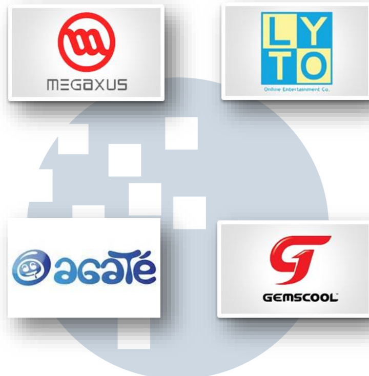
Gambar 2.2 Partnership Company INIGAME