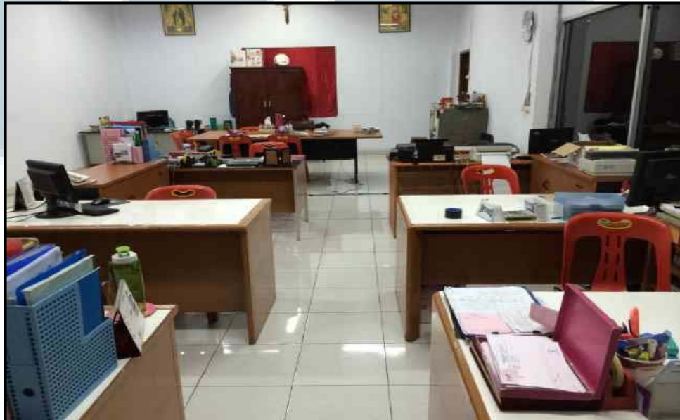
Gambar 2.3. Kantor UD. Multidaya