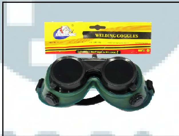
Gambar 2.5. Contoh Produk Kaca Mata Las Bulat RRT