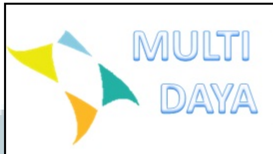
Gambar 2.1. Logo UD. Multidaya