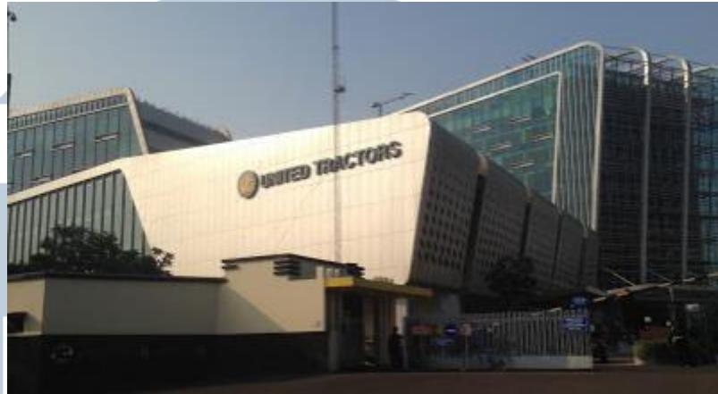
Gambar 2.1. Gedung UT