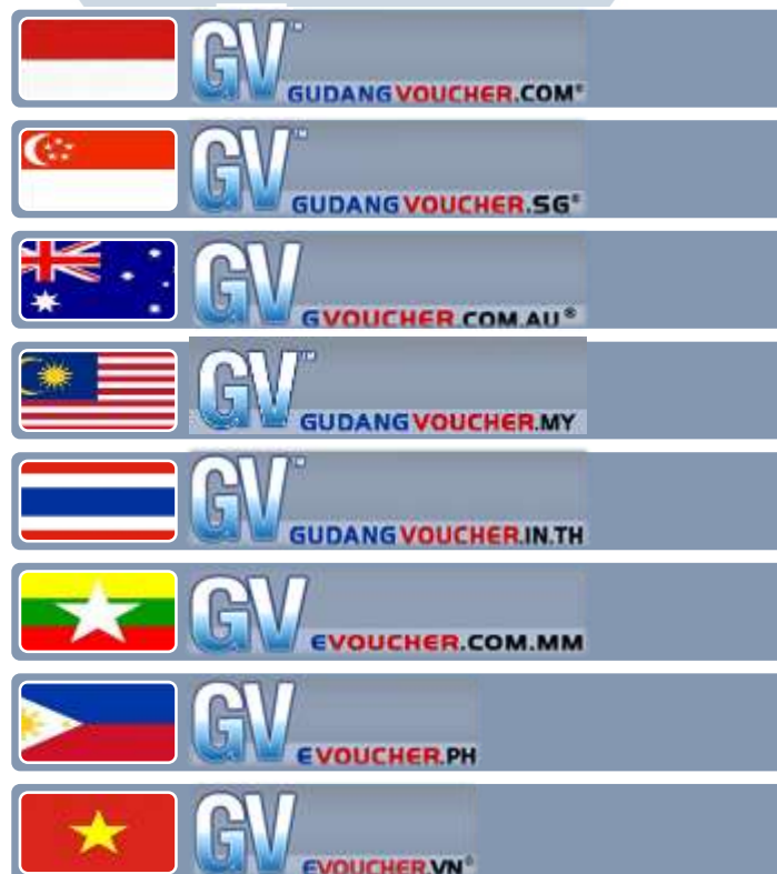
Gambar 2.1. List website GudangVoucher di berbagai negara.

Salah satu produk PT. Buana Media Teknologi, GudangVoucher.com saat ini telah memiliki cabang di beberapa negara selain Indonesia diantaranya Singapura, Vietnam, Malaysia, Myanmar, Filipina, Thailand, dan Australia. Berikut ini adalah list website GudangVoucher di berbagai negara tersebut :