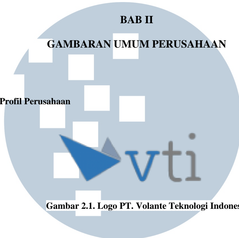
Gambar 2.1. Logo PT. Volante Teknologi Indonesia

Nama Perusahaan : PT. Volante Teknologi Indonesia (VTI)