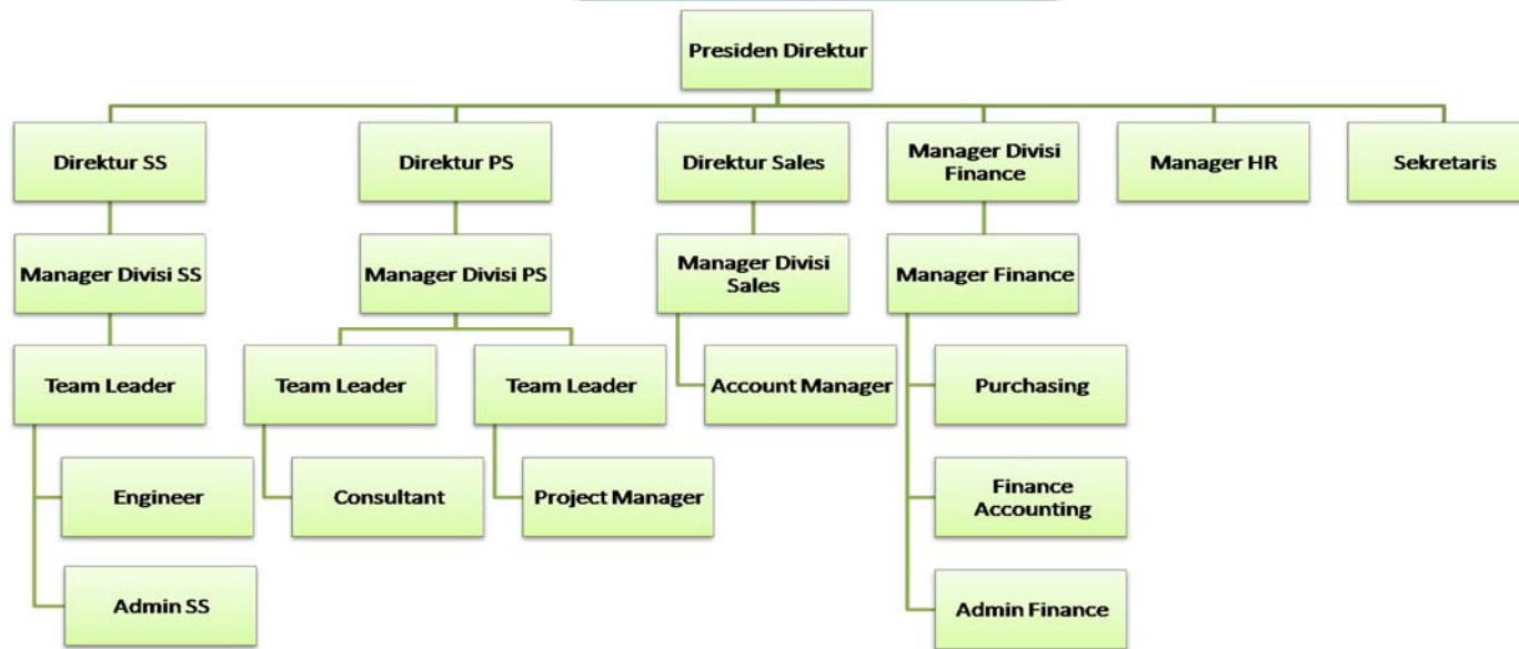
Gambar 2.4 Struktur Organisasi PT. Packet Systems Indonesia