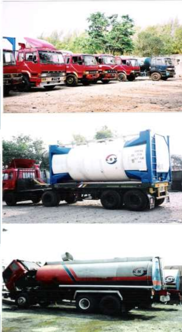
Gambar 2.2 Foto truk tangki dan isotank

Foto diatas merupakan foto salah satu truk yang dimiliki PT KURNIA SAKTI WIBAWA, truk – truk tersebut ditempatkan di pool yang berguna untuk menampung seluruh truk yang akan beroperasi atau bisa juga sebagai garasi. Di dalam pool ini