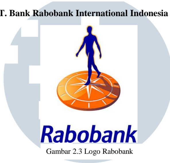
Gambar 2.3 Logo Rabobank