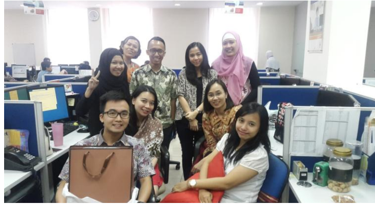
Gambar 2.2 Lantai 2 Divisi Operation Development and Support