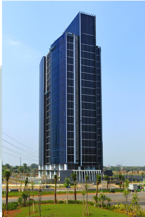
Gambar 2.2 Gedung Synergy Building Milik PT Alam Sutera Realty Tbk