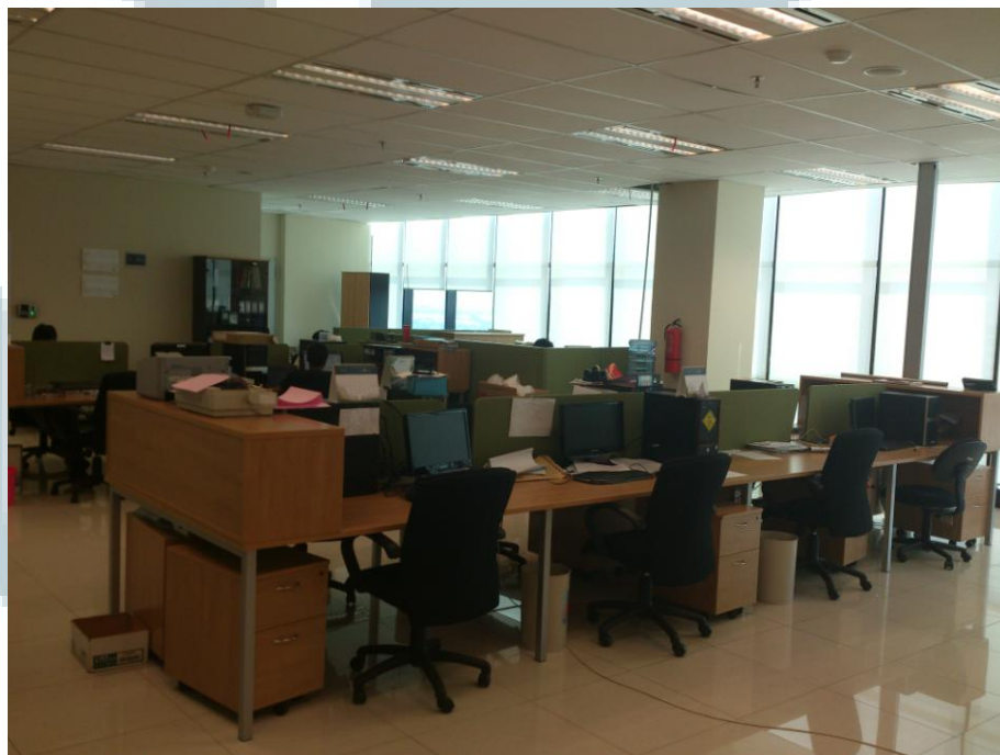
Gambar 2.3 Workspace Divisi IT Yang Diambil Saat Akhir Pekan (Sabtu)