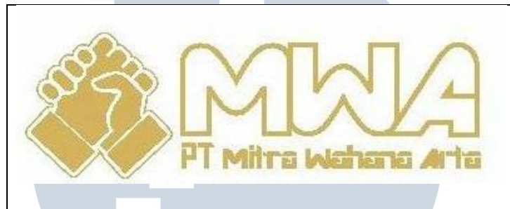
Gambar 2.1 Logo Perusahaan Mitra Wahana Arta

Berikut ini adalah sejarah singkat PT Mitra Wahana Arta serta logo perusahaan yang dapat dilihat pada Gambar 2.1.