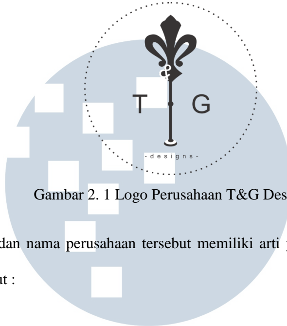
Gambar 2. 1 Logo Perusahaan T&G Desain

Misi: Always be creative and innovative.