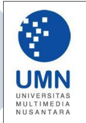
Gambar 2.1 Logo UMN

Universitas Multimedia Nusantara yang disingkat UMN didirikan pada tanggal 25 November 2005 berdasarkan Surat Keputusan Menteri Pendidikan Nasional No. 169/D/O/2005 yang operasionalnya secara resmi dikelola oleh Yayasan Multimedia Nusantara. Yayasan ini didirikan oleh Kompas Gramedia, sebuah kelompok usaha terkemuka yang bergerak dalam bidang media massa,