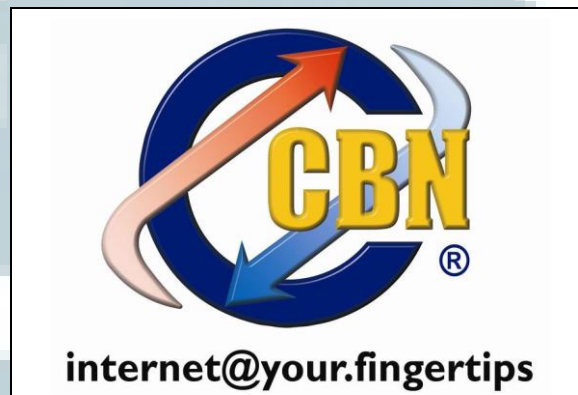
Gambar 2.1 Logo PT Cyberindo Aditama

Sepanjang sejarah industri komunikasi di Indonesia, CBN telah menjadi pelopor yang berfokus dalam bisnis, berkomitmen dalam pelayanan dan berinovasi pada produk. Didirikan pada tahun 1995 sebagai PT Cyberindo Aditama, CBN telah tumbuh sebagai salah satu ISP terpercaya di Indonesia dengan berbagai layanan internet. Sejak Agustus 2008, CBN secara resmi diberikan lisensi dari NAP ( Network Access Provider ), karena CBN memiliki kebebasan untuk mengembangkan infrastruktur sendiri.