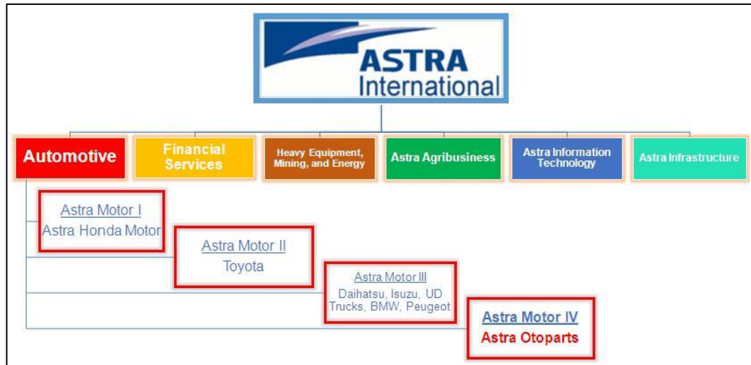
Gambar 2.2 Struktur Grup Perusahaan (PT Astra Otoparts Tbk, 2017)

Secara umum struktur organisasi PT Astra Otoparts terbagi menjadi tiga, yakni Corporate Functions , Corporate Operations , dan Anak Perusahaan ( Subsidiaries ). Corporate Functions merupakan bagian yang bertanggung jawab untuk mendefinisikan segala kebijakan yang berkaitan dengan seluruh bentuk aktivitas di Corporate Operations .