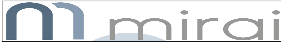
Gambar 2.1 Logo PT Mirai Internasional Indonesia

Gambar 2.1 merupakan logo perusahaan PT Mirai Internasional Indonesia yang telah berdiri sejak tahun 2013.