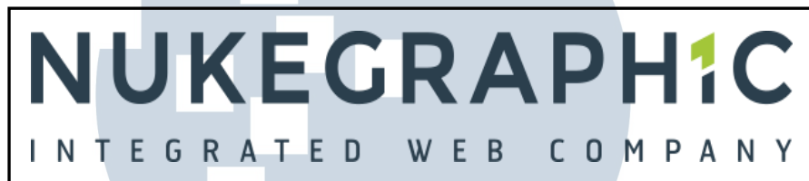
Gambar 2.1 Logo Perusahaan (Nukegraphic Indonesia, 2012)

CV Nukegraphic Indonesia adalah perusahaan yang bergerak dalam bidang jasa perancangan dan pengembangan website . Jenis website yang ditangani oleh CV Nukegraphic Indonesia dapat berupa corporate website , e-commerce , dan custom website yang sesuai dengan kebutuhan customer .