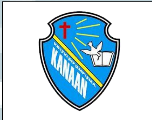
Gambar 2.1 Logo Sekolah Menengah Atas Kristen Kanaan

Berdasarkan dokumentasi, Sekolah Menengah Atas Kristen Kanaan Tangerang, beroperasi pada tahun pelajaran 1996/1997, berlokasi di jalan Sukamanah V No.11 Tangerang. Seperti halnya dengan sekolah Kanaan dari cabang lain, maka latar belakang berdirinya memiliki alasan kurang lebih adalah sama, yaitu untuk menampung siswa lulusan SMP Kristen Kanaan Tangerang.