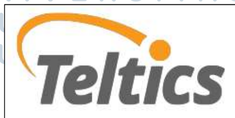
Gambar 2.1 Logo PT Teltics Media

PT Teltics Media merupakan perusahaan yang didirikan pada Februari 2005 oleh tiga pendiri berpengalaman di bidang Information Technology (IT) dan software development . Didorong dengan berkembangnya kebutuhan masyarakat akan mobile service , website development , dan business solution , PT Teltics Media menawarkan jasa IT solutions bagi pelaku bisnis yang membutuhkan sistem terkomputerisasi untuk menunjang kebutuhan bisnis perusahaan. Sadar akan perubahan yang sangat cepat di bidang IT, PT Teltics Media berusaha untuk terus belajar agar dapat mengikuti perkembangan zaman dan memenuhi kebutuhan para pelanggan yang telah memilih PT Teltics Media sebagai partner bisnis. PT Teltics Media berfokus pada pengembangan software atau aplikasi berbasis mobile (Android dan iOS), serta menawarkan jasa IT solutions menggunakan Grails, Java (JEE dan JME), Symbian, PHP (berbagai framework seperti Laravel, Yii, CodeIgniter), Python, eGroupware dan OpenERP. Gambar 2.1 merupakan logo dari PT Teltics Media.