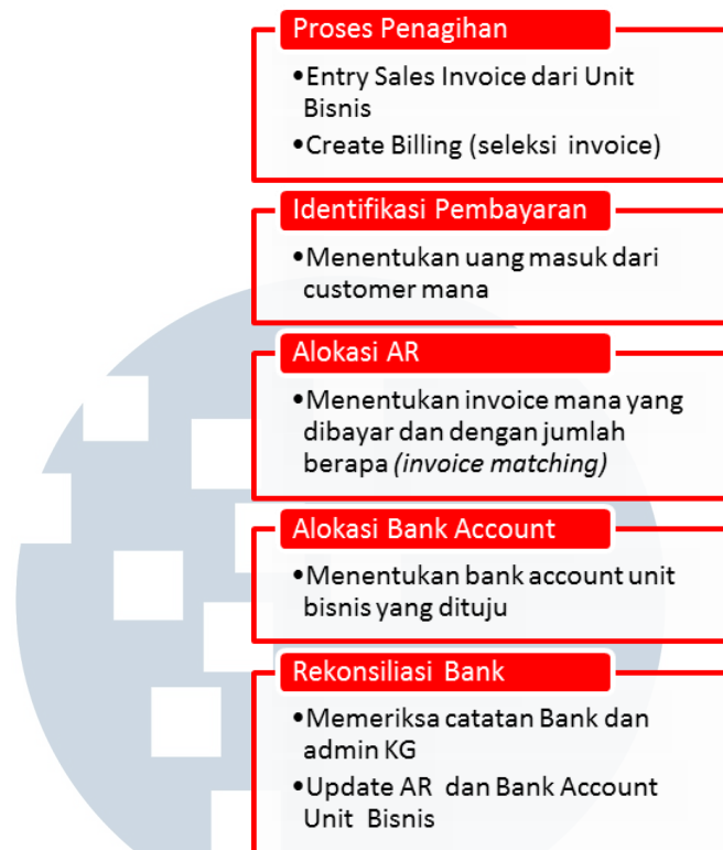
Gambar 1.2 Proses penagihan hutang manual

Dengan adanya proses komputerisasi, maka proses-proses tersebut akan dilakukan melalui sistem seperti digambarkan pada gambar 1.3.