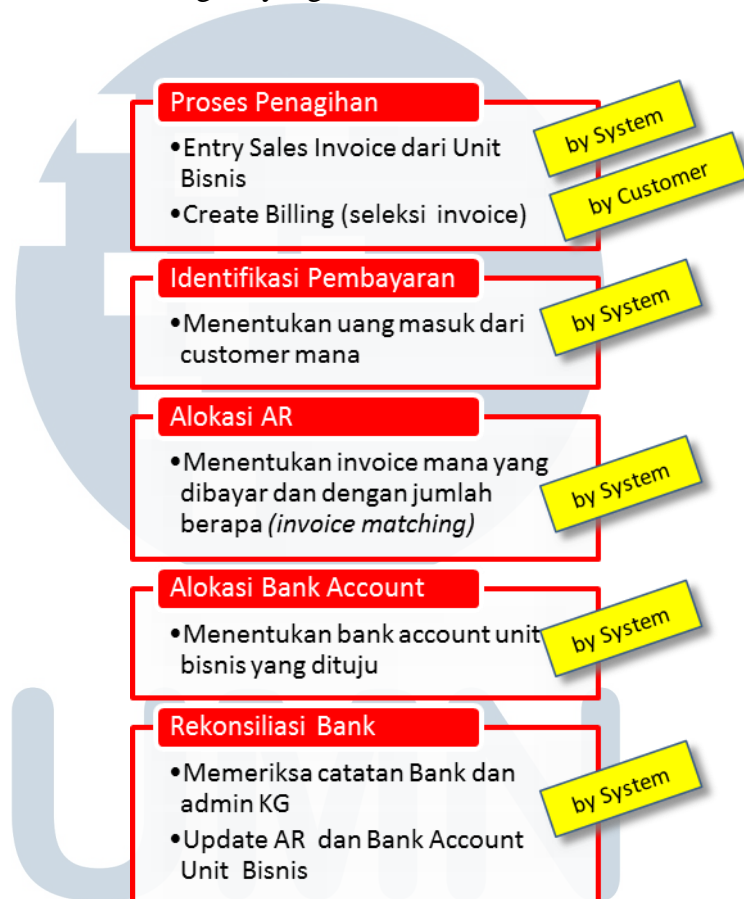
Gambar 1.3 Proses penagihan hutang dengan komputerisasi

Pada proses pembayaran ke unit bisnis juga sudah dilakukan sistem melalui kode billing yang berbeda-beda untuk setiap unit bisnis. Rekonsiliasi bank juga dilakukan sistem dengan menggunakan laporan bank dalam bentuk digital yang dikirimkan secara berkala.