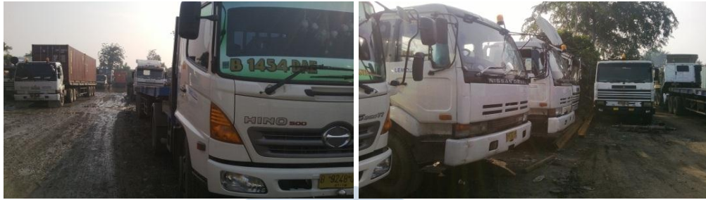
Gambar 2.2 Armada Lemo Utama