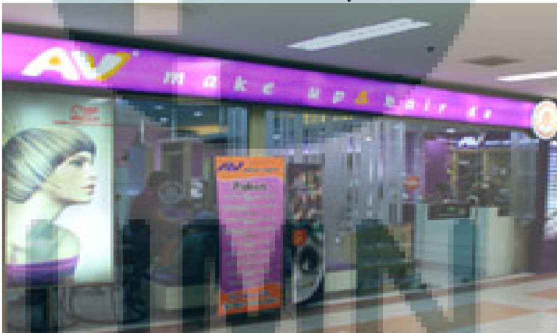
Gambar 2.1 Outlet ITC BSD City