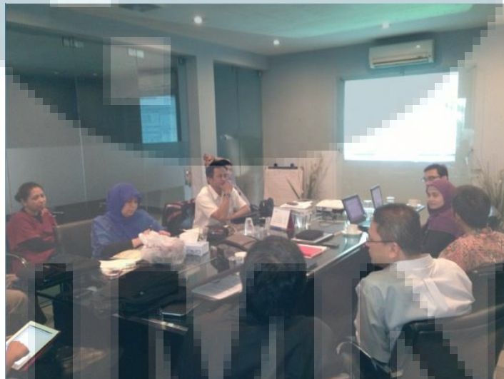
Gambar 1.11 Suasana Meeting di ESQ