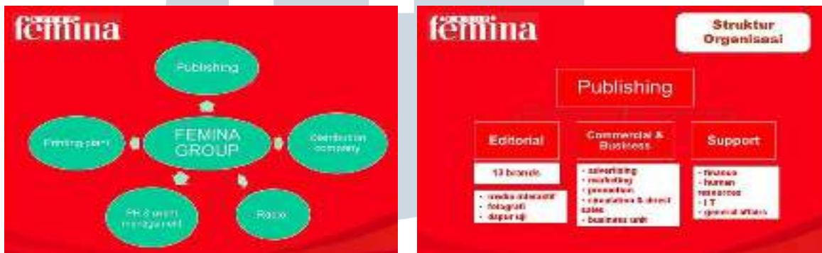
Gambar 2.2 Struktur Perusahaan Femina Group

Penulis melakukan praktik kerja magang di Femina Group pada bagian Publishing, tepatnya di Editorial bagian Image Division . Selibuhnya, adapun struktur organisasi Femina Group dapat dilihat sebagai berikut.