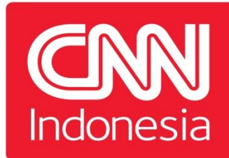
gambar 2.1: Logo Perusahaan