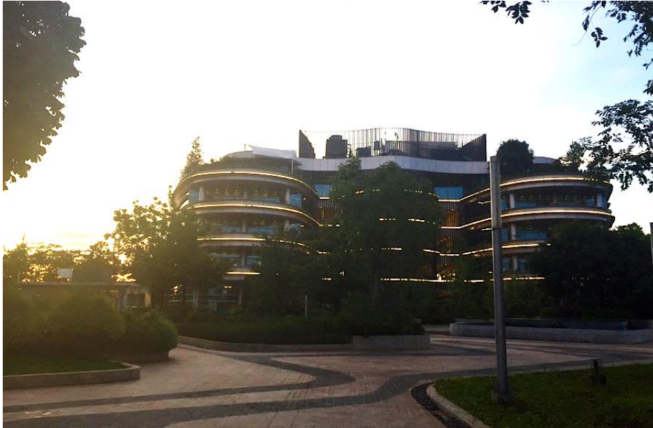
Gambar 2.1 Sinar Mas Land Plaza BSD Green Office Park

Strategi model bisnis berkelanjutan Sinar Mas Land ditandai dengan melihat dan berpikir dengan skala jauh dan jangka panjang untuk menangkap potensi pertumbuhan terbaik, mengurangi resiko, dan memanfaatkan peluang seluruh fase dan siklus properti. (arsip perusahaan “Sinar Mas Land Company Profile ”, 2017)