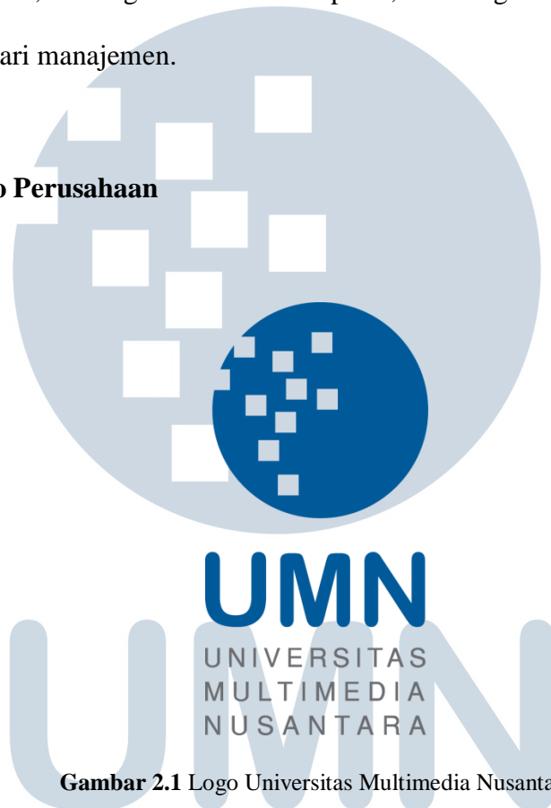
Gambar 2.1 Logo Universitas Multimedia Nusantara

Makna dari logo Universitas Multimedia Nusantara adalah sebagai berikut :